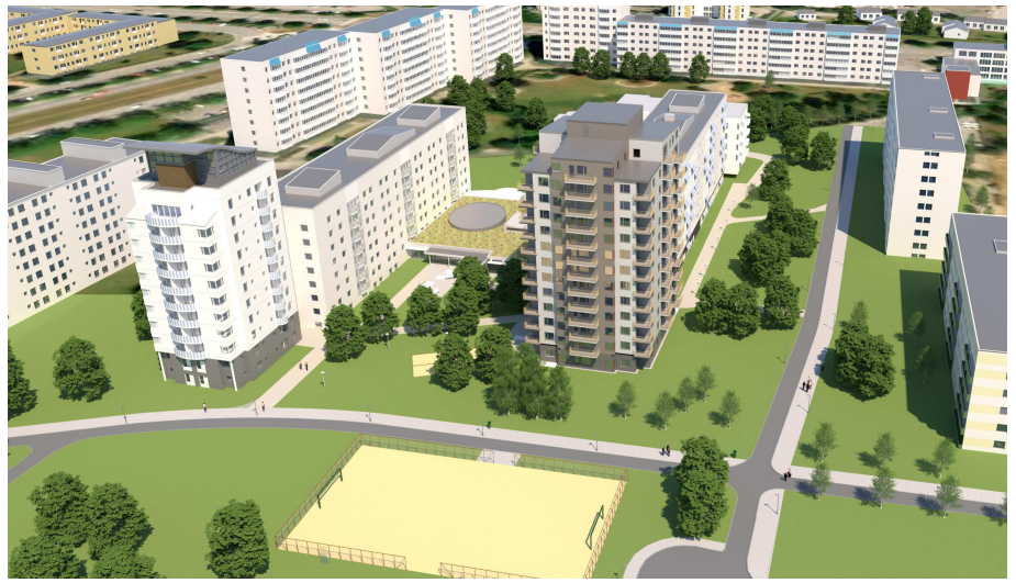
Illustration: Arkitektgruppen i Malmö AB