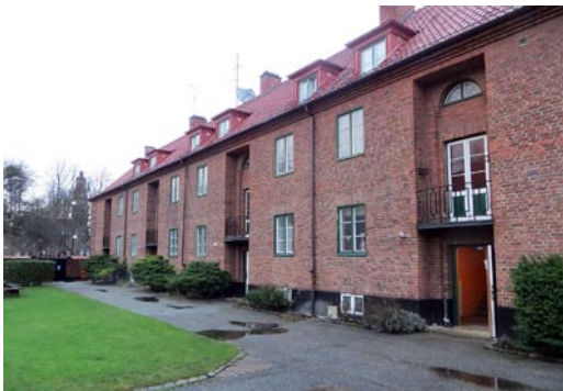
Smedjegatan vid Tandläkarehögskolan och UMAS