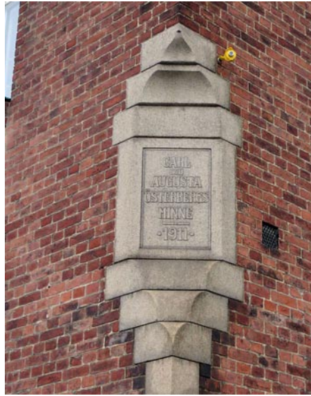
Österbergska Stiftelsens byggnad från 1911 på Rådmansgatan, ett stenkast från Smedjegatan. Fasad och fasaddetalj