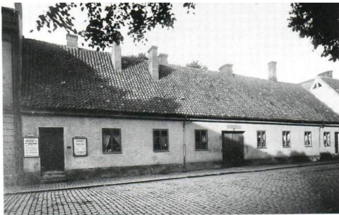
Mitt emot von Conowska stiftelsen låg S:t Petri kyrka och en plantering som bla tjänade som lekplats. "Velocipedtäflingar på Malmö idrottsplats" annonseras på husväggen.